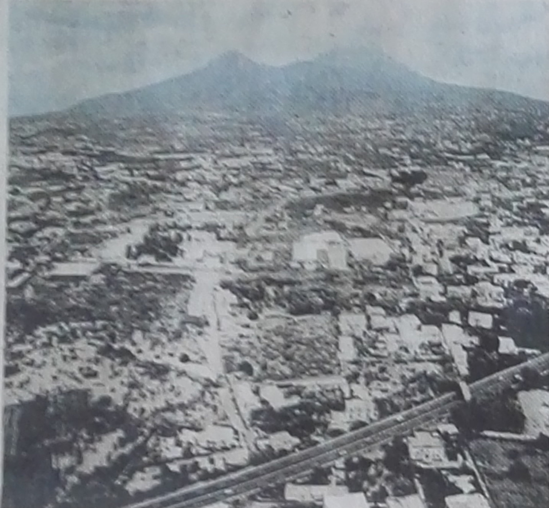
A destra un'esercitazione di Protezione civile per i residenti nella zona rossa del Vesuvio. Qui sotto una panoramica del «mare» di cemento alle falde del vulcano

popolazione residente nelle zone rosse da attuare in caso di rischio vulcanico che punti alla valorizzazione delle aree interne della Regione». È uno degli obiettivi del progetto (non a caso in perfetta sintonia con la Strategia nazionale per le aree interne e il successivo accordo con l'Ue del 2015) che vuole ovviamente garantire alla popola-